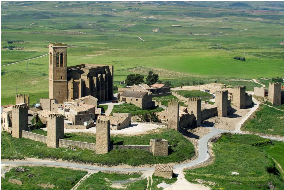
Figura 1.4. Cerco de Artajona.

Es una población con siglos de historia. En ella se han encontrado restos de un asentamiento romano fechado entre los siglos I a.C y II d.C o referencias medievales como el impresionante conjunto amurallado de "El Cerco".