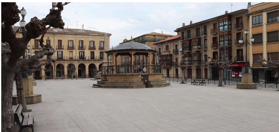
Figura 1.3. Plaza de don Francisco de Navarra.

En la actualidad el tejido industrial lo componen algo más de 600 empresas dedicadas a una amplia variedad de actividades industriales y creándose muchas de ellas en torno a empresas de mayor envergadura, locales y regionales como pueden ser los casos de Fagor Ederlan Tafalla, Pelzer del Norte, Berlys Alimentación o Navarra Maquinaria Agrícola. Este tipo de empresas tractoras, además del elevado número de personas empleadas que poseen, han generado un gran número de empresas auxiliares en torno a ellas, por lo que su contribución directa o indirecta al desarrollo de la zona es incuestionable.