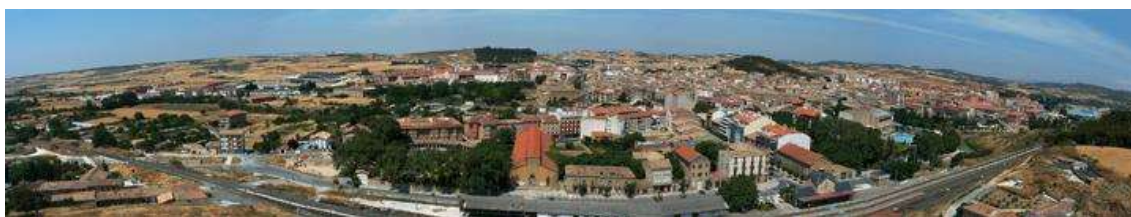
Figura 1.2. Vista de Tafalla.

Su fisonomía urbana mantiene características medievales que se aprecian en las viejas calles empedradas de la zona más antigua. En la parte baja, presenta un aspecto más moderno, con un comercio variado que atiende las necesidades de toda la comarca. En esta zona central se sitúan la mayoría de los servicios públicos.