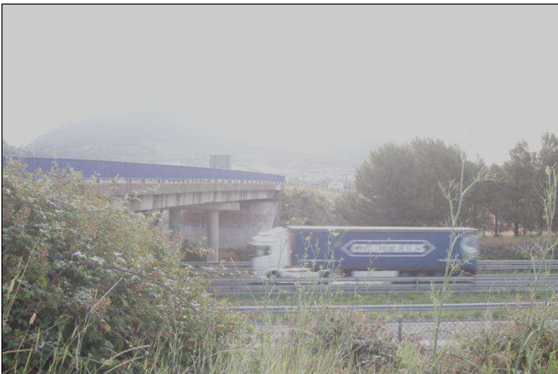
Foto 18. Zona de la traza cercana a la autopista y al desvío hacia Echagüe/Oloriz.