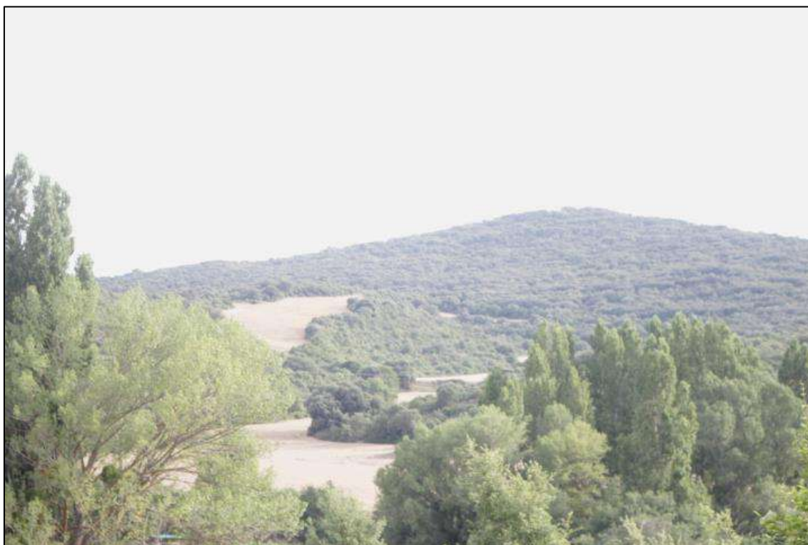
Foto 16. Futura traza del tendido en la zona norte de Solchaga.