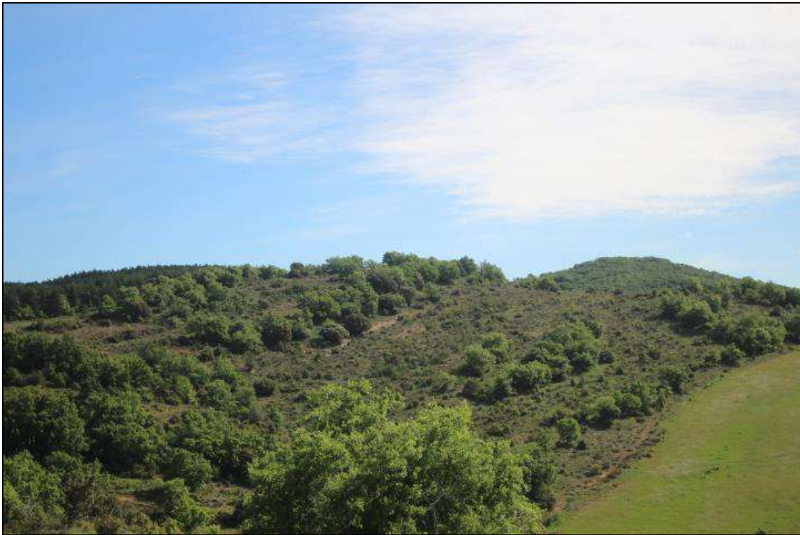
Foto 5. Zona de la futura posición BM7.