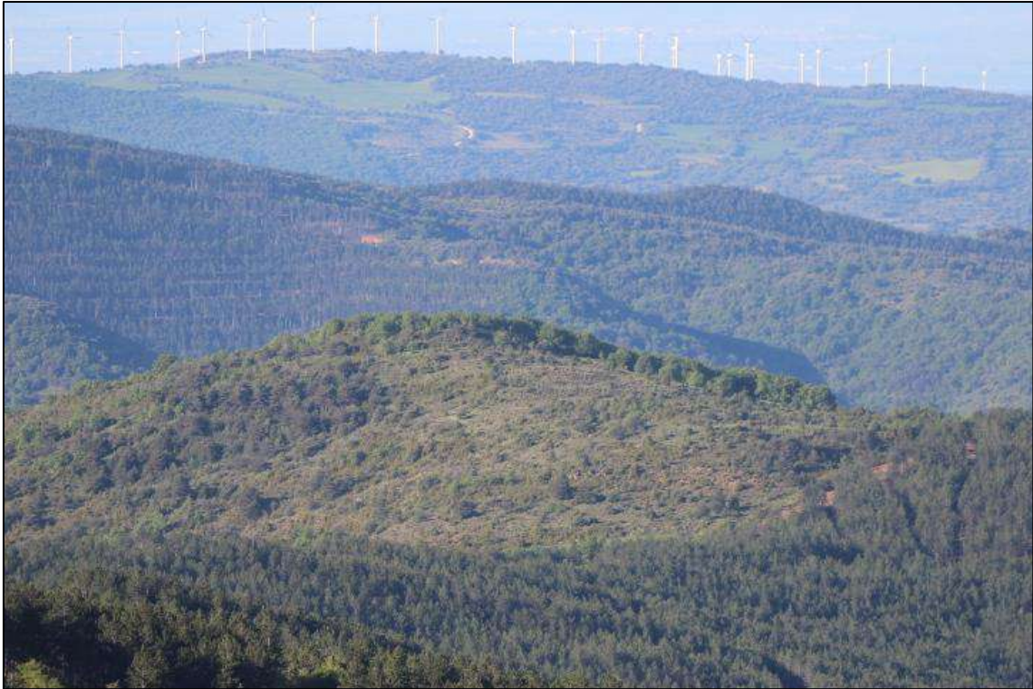
Foto 3. Zona de la futura posición BM3.