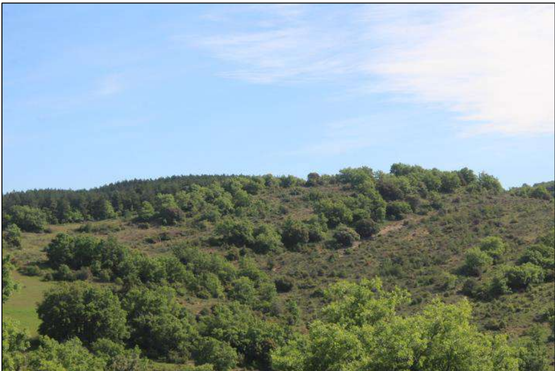
Foto 4. Zona de la futura posición BM8.