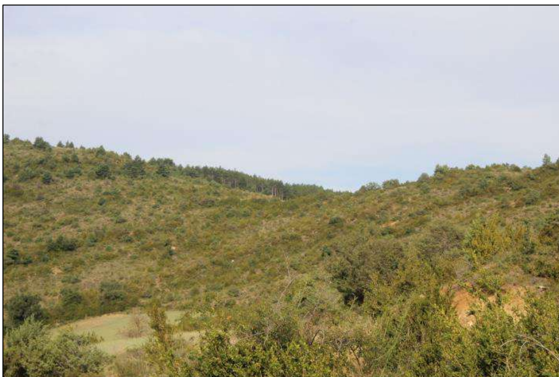
Foto 10. Zona del futuro trazado al NW de Iratxeta.