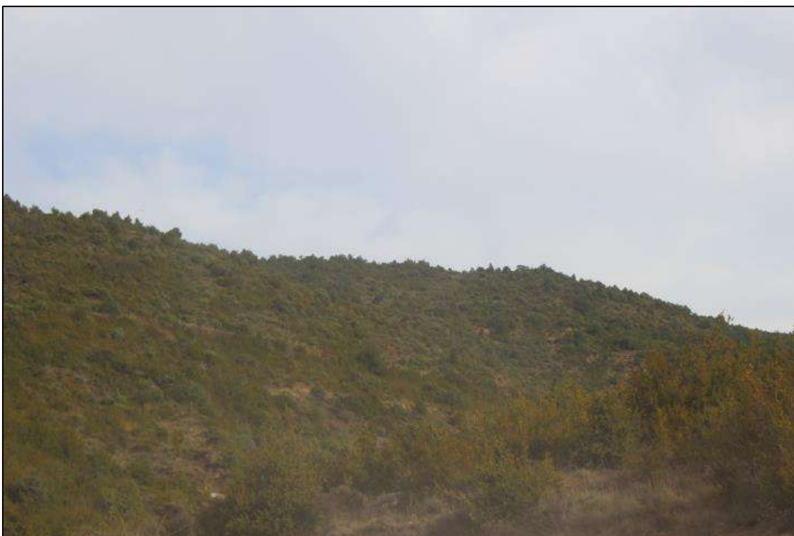
Foto 12. Futura traza del tendido hacia el NE de Artariain.