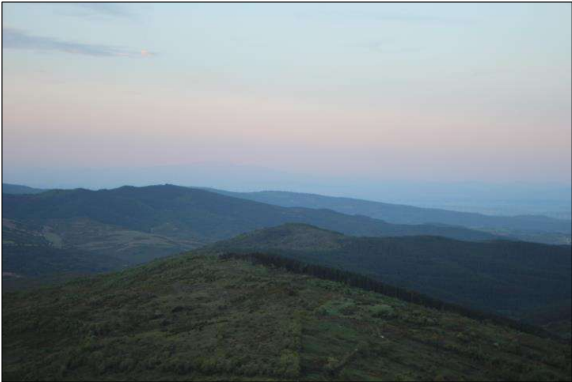
Foto 1. Loma donde se ubicará el futuro parque de Barranco de Mairaga con las posiciones BM4, BM5 y BM6.