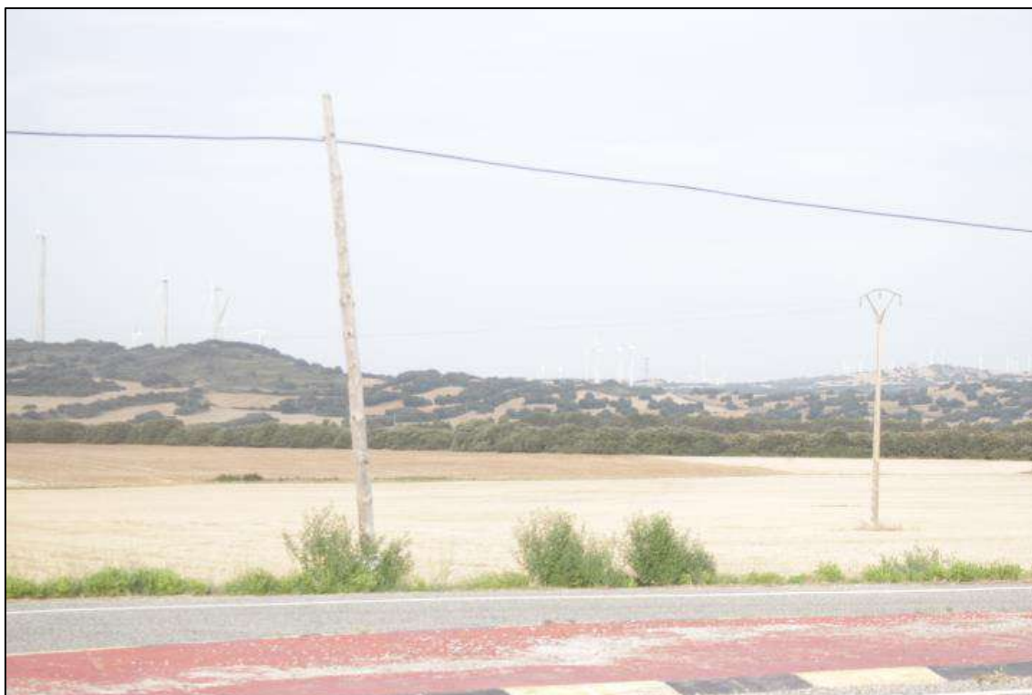
Foto 19. Futura traza del tendido en paralelo a la Autopista A-15 y cerca del desvío a Echagüe.