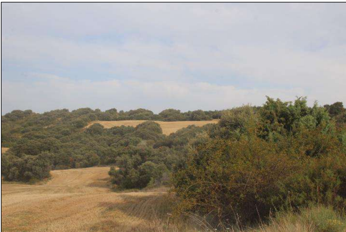
Foto 14. Futura traza del tendido en hábitat agrícola y forestal (carrasca) (Artariain).