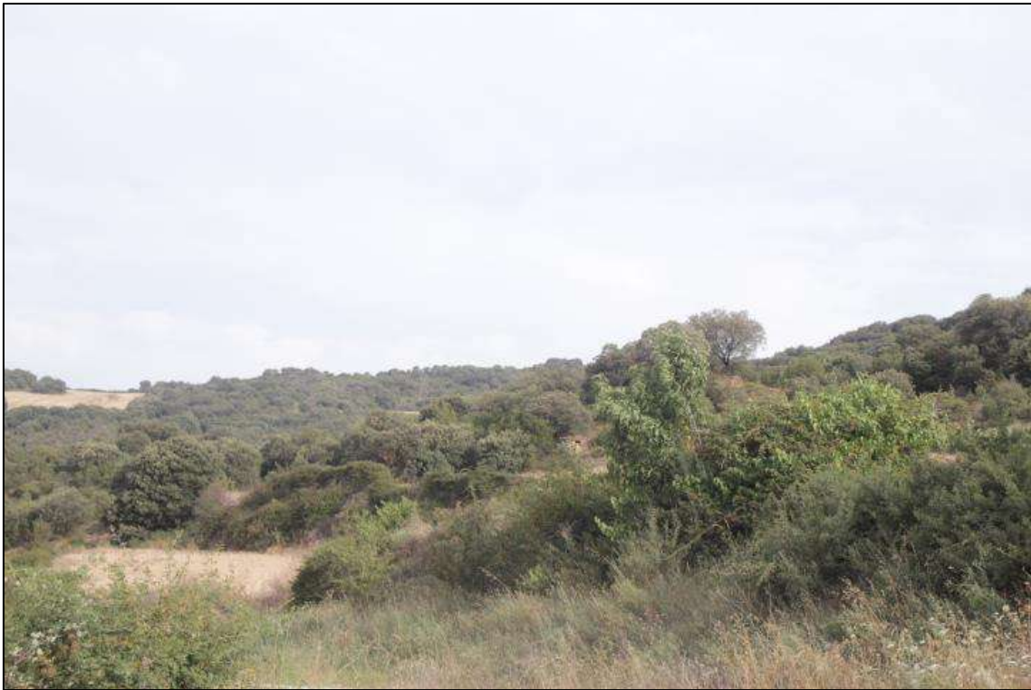
Foto 13. Futura traza del tendido en hábitat agrícola y forestal (carrasca) (Artariain).