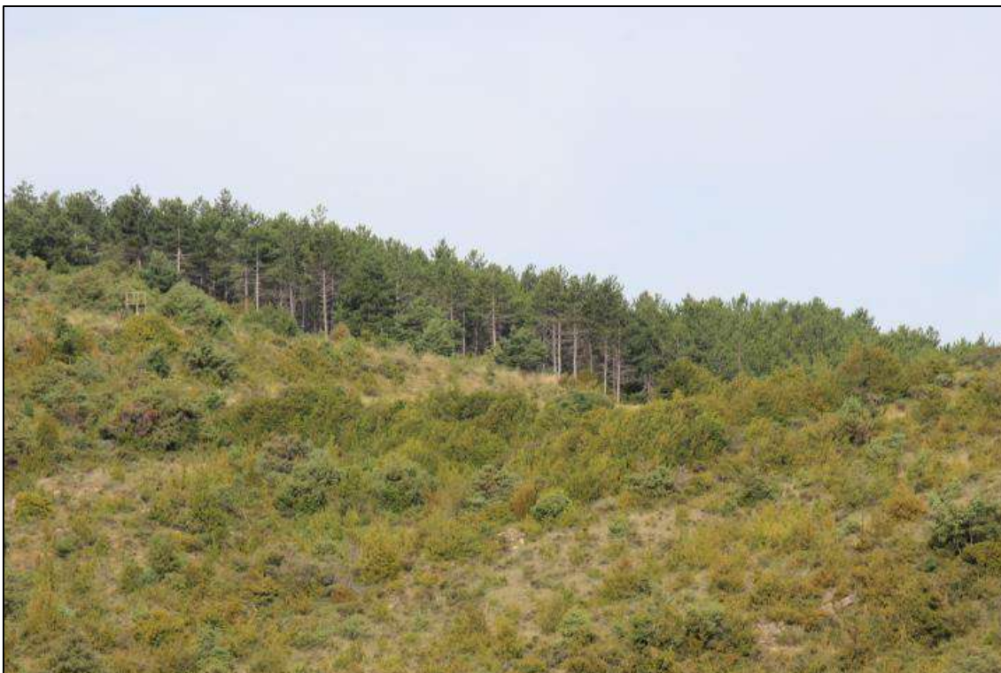
Foto 11. Zona de transición entre un pinar de repoblación, boj y carrasca.