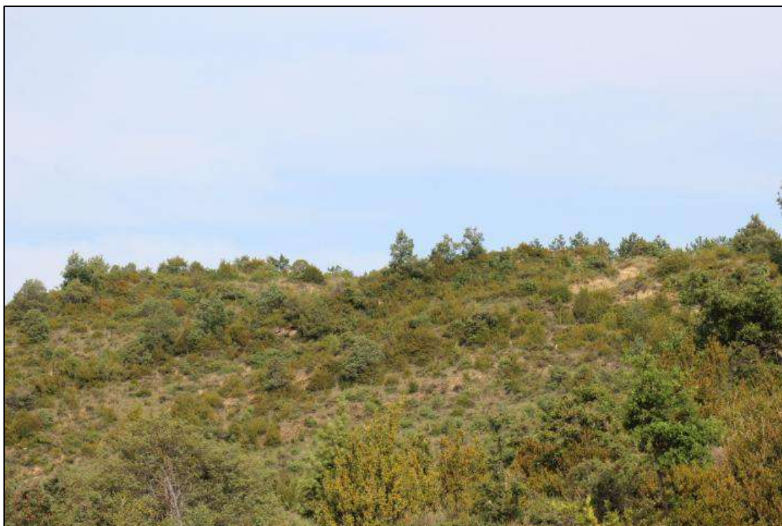
Foto 9. Inicio del trazado del futuro tendido al N de Iratxeta.