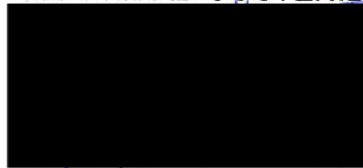
Bérta Miranda Ordobás

LA DIRECTORA GENERAL DE TRANSPORTES Y MOVILIDAD SOSTENIBLE