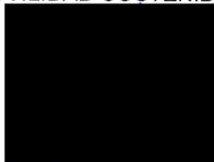
Berta Miranda Ordobás

LA DIRECTORA GENERAL DE TRANSPORTES Y MOVILIDAD SOSTENIBLE