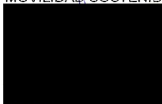
Berta Miranda Ordobás

LA DIRECTORA GENERAL DE TRANSPORTES Y MOVILIDAD SOSTENIBLE