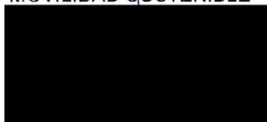
Berta Miranda Ordobás

LA DIRECTORA GENERAL DE TRANSPORTES Y MOVILIDAD SOSTENIBLE