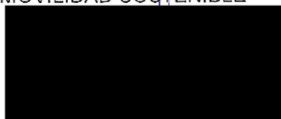
Berta Miranda Ordobás

LA DIRECTORA GENERAL DE TRANSPORTES Y MOVILIDAD SOSTENIBLE