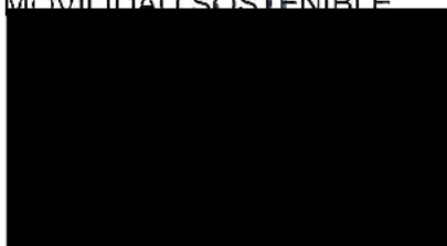
Berta Miranda Ordobás

LA DIRECTORA GENERAL DE TRANSPORTES Y MOVILIDAD SOSTENIBLE