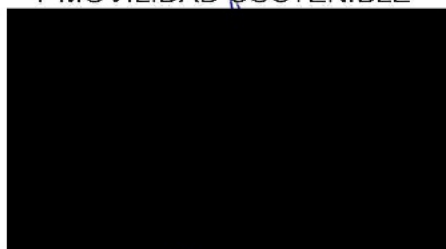
Berta Miranda Ordobás

LA DIRECTORA GENERAL DE TRANSPORTES Y MOVILIDAD SOSTENIBLE