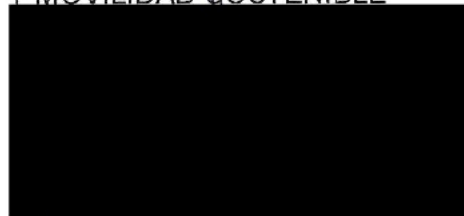
Berta Miranda Ordobás

LA DIRECTORA GENERAL DE TRANSPORTES Y MOVILIDAD SOSTENIBLE