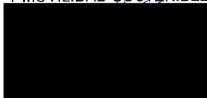
Berta Miranda Ordobás

LA DIRECTORA GENERAL DE TRANSPORTES Y MOVILIDAD SOSTENIBLE