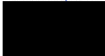
Berta Miranda Ordobás

LA DIRECTORA GENERAL DE TRANSPORTES Y MOVILIDAD SOSTENIBLE