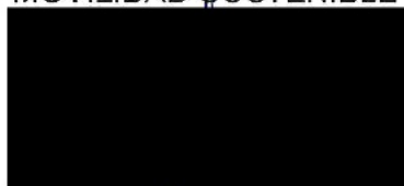
Berta Miranda Ordobás

LA DIRECTORA GENERAL DE TRANSPORTES Y MOVILIDAD SOSTENIBLE