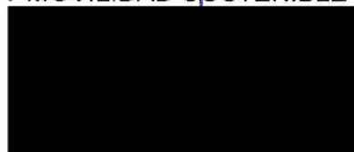
Berta Miranda Ordobás

LA DIRECTORA GENERAL DE TRANSPORTES Y MOVILIDAD SOSTENIBLE