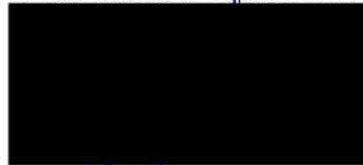
Berta Miranda Ordobás

LA DIRECTORA GENERAL DE TRANSPORTES Y MOVILIDAD SOSTENIBLE