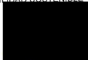
Berta Miranda Ordobás

LA DIRECTORA GENERAL DE TRANSPORTES Y MOVILIDAD SOSTENIBLE