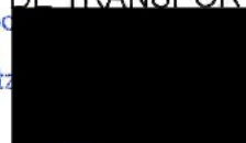
Estela Moso Sarasa

.- SRA. DIRECTORA GENERAL DE TRANSPORTES Y MOVILIDAD SOSTENIBLE.