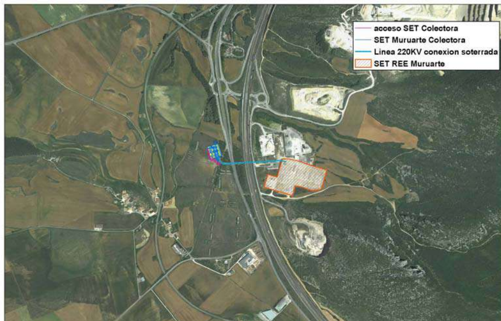
Imagen 3. Implantación de infraestructuras sobre ortofotomapa