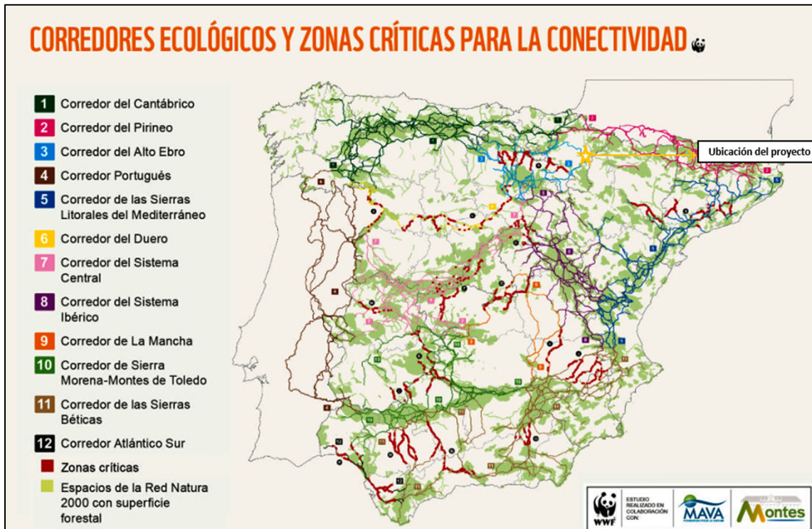
Ilustración 3. Corredores ecológicos respecto al proyecto (2/2).

Por tanto, el proyecto no afectaría a ningún corredor ecológico ni mucho a menos a alguna de sus zonas críticas para la conectividad.