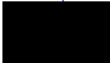
Berta Miranda Ordobás

LA DIRECTORA GENERAL DE TRANSPORTES Y MOVILIDAD SOSTENIBLE