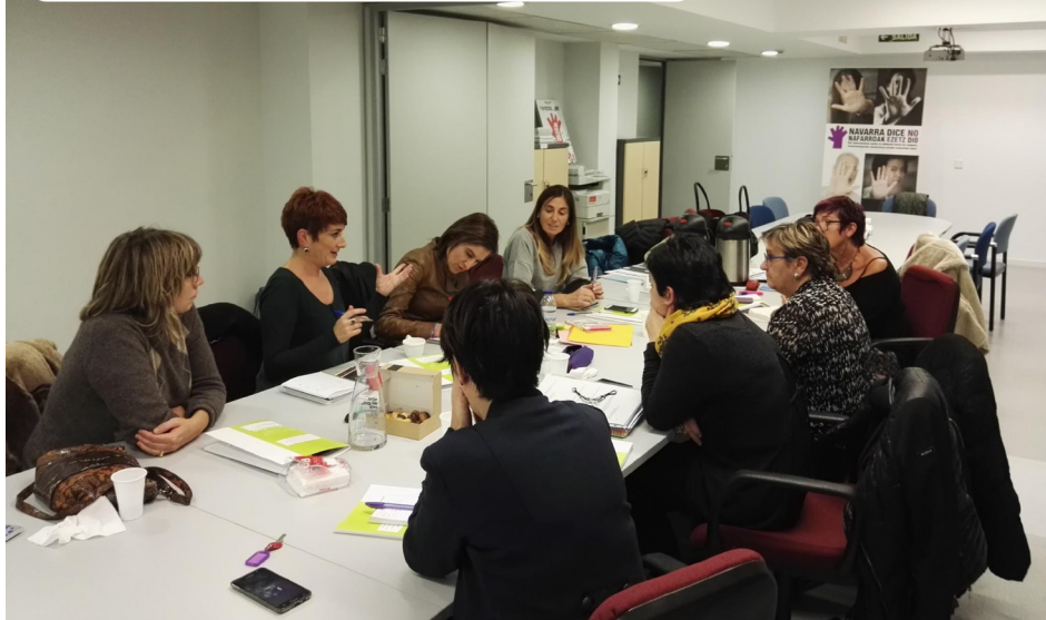
Mujeres parlamentarias. Emakume parlamentarioak