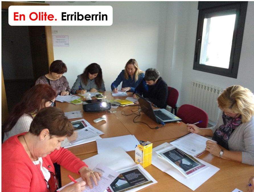
En Olite. Erriberrin