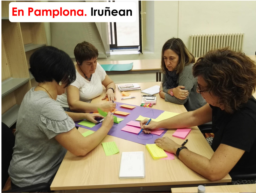
En Pamplona. Iruñean