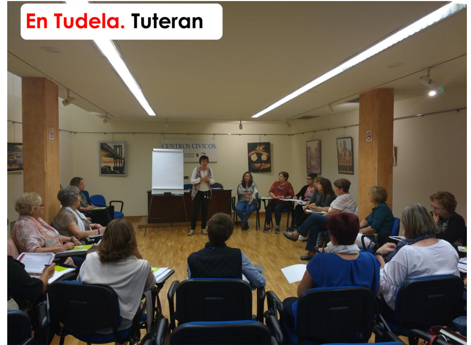
En Tudela. Tuteran