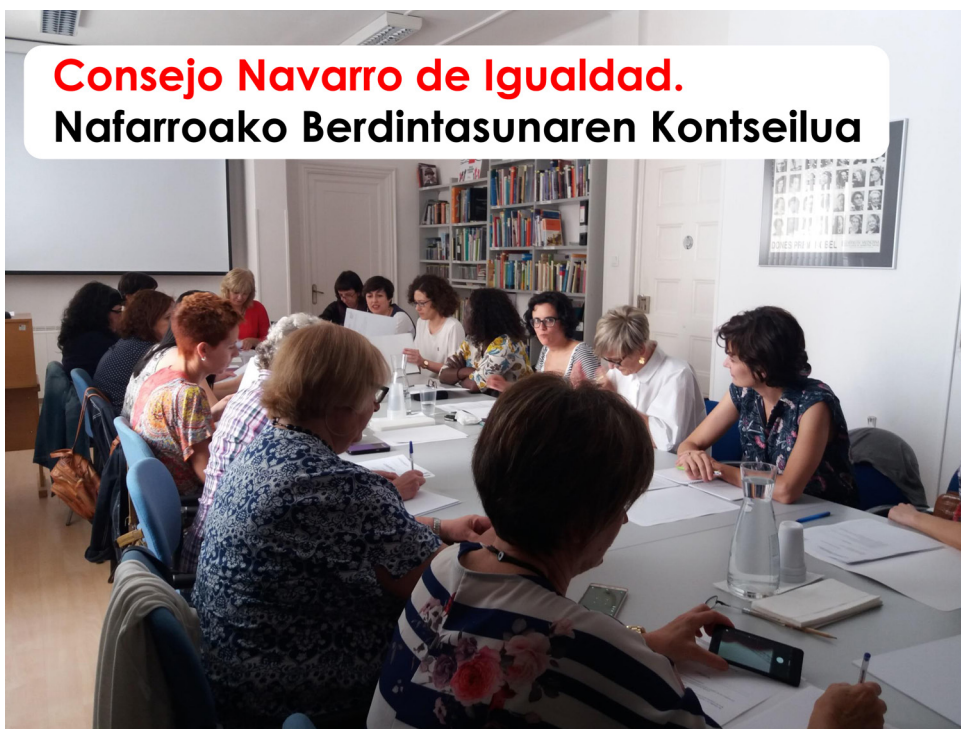
Consejo Navarro de Igualdad. Nafarroako Berdintasunaren Kontseilua