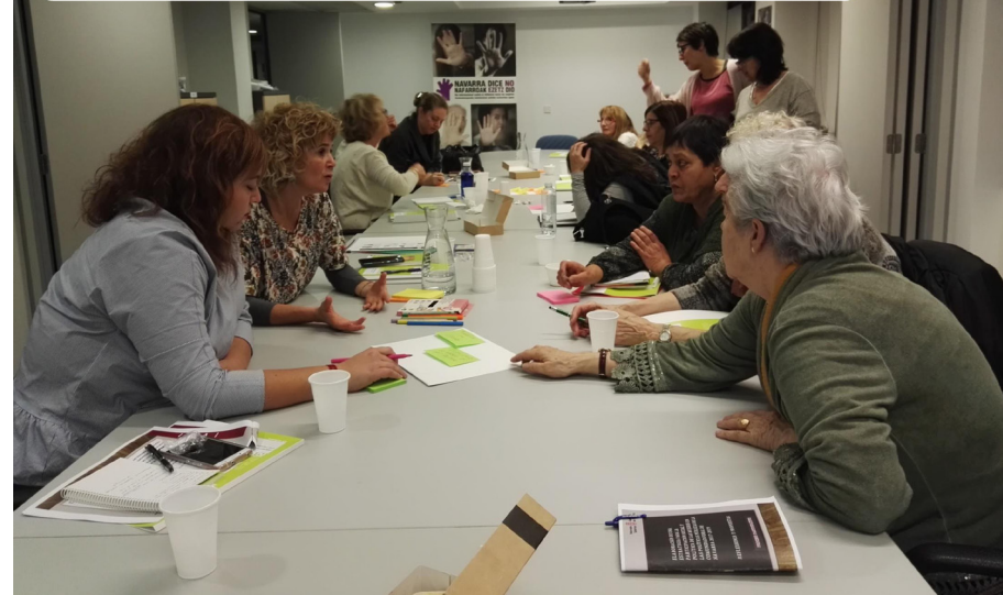
Mujeres alcaldesas y concejales. Alkate emakumeak eta zinegotziak