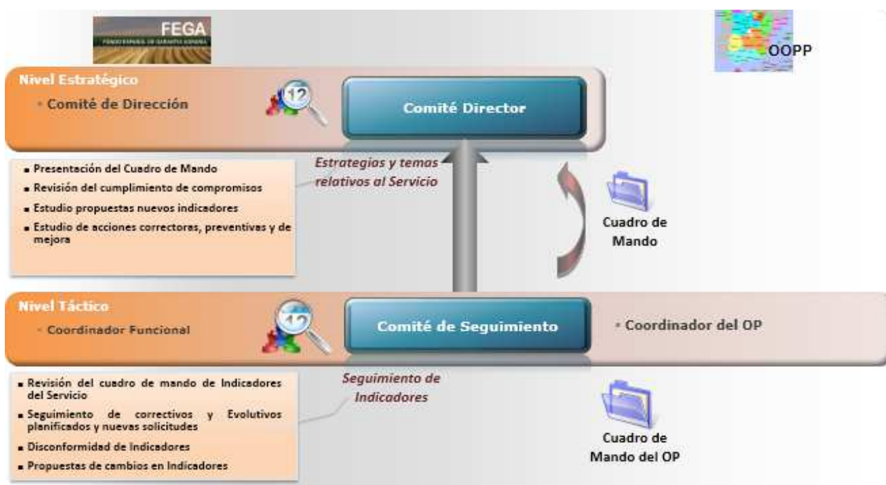
Ilustración 3. Modelo de control y seguimiento de indicadores

proyecto. Este Comité revisará periódicamente la adecuación de los indicadores de nivel de servicio a las necesidades del OP y al volumen de actividad real, estudiando la progresión de los mismos. Tras estas revisiones podrá aprobar diversas acciones correctivas, tales como: reorganización de equipos, mejoras de procesos operativos de soporte, recursos humanos y modificaciones en niveles de servicio y/o en la valoración de los servicios.