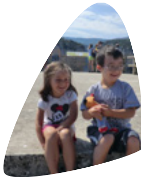
Haurtzaroa 4-12 urte