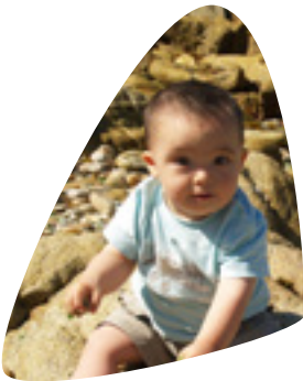
Lehen haurtzaroa 0-3 urte