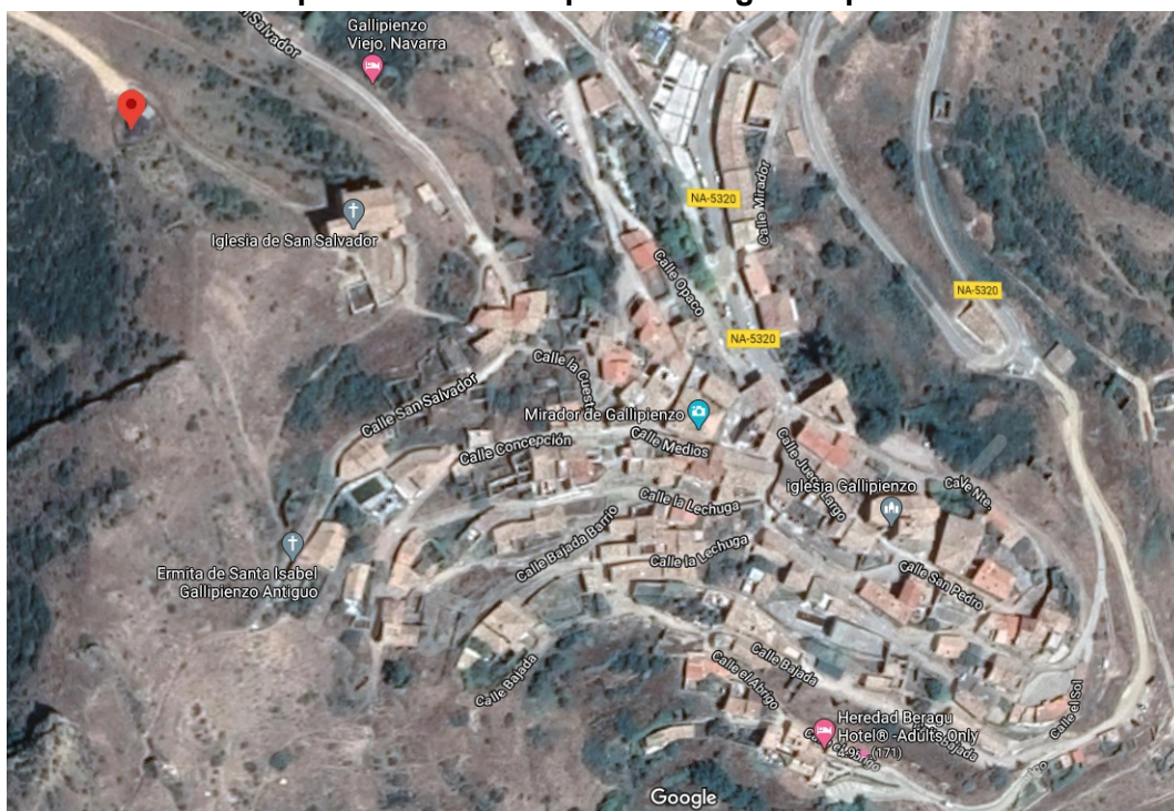
Emplazamiento Gallipienzo antiguo Depósito