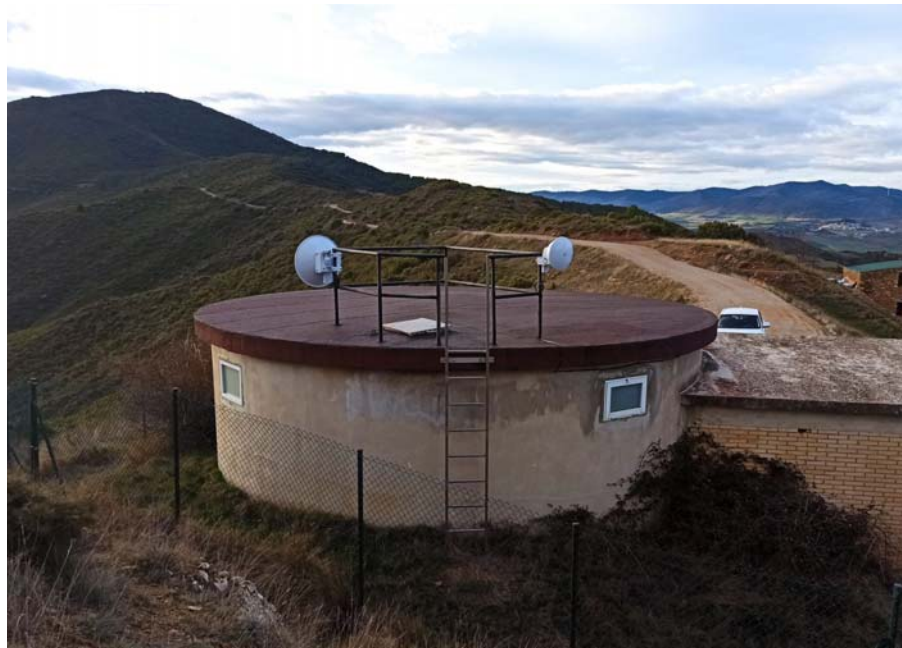
Gallipienzo antiguo depósito