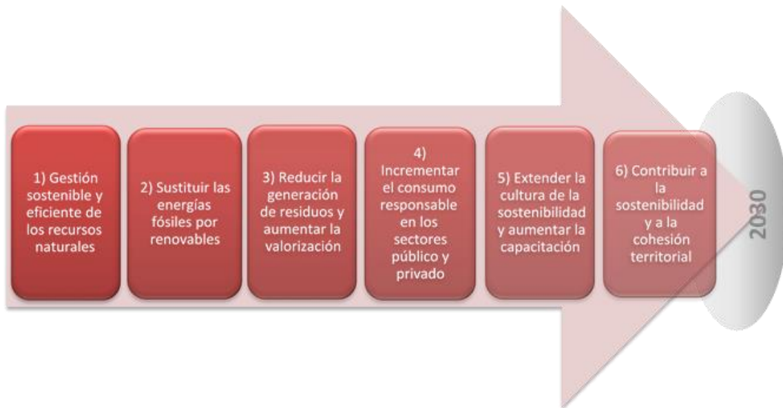
Figura 3 Objetivos generales de la ECNA 2030

La ECNA 2030 establece los siguientes objetivos generales: