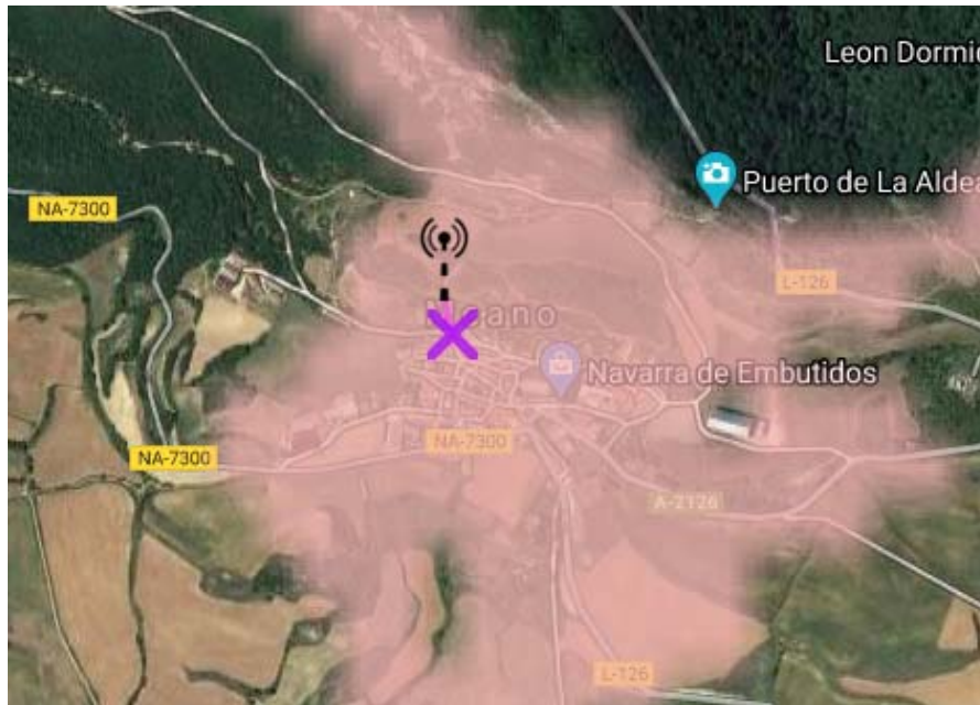
Primera zona de cobertura: Meano dotará a la población completa..

Estacion base de radiocomunicaciones propuestas y denominadas Meano, cuyo punto a punto es: Meano dotará de cobertura al municipio completo. En las siguientes imágenes se refleja con claridad: