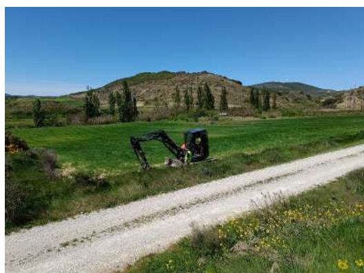
Procesos de trabajo, ubicación y detalles de resultados del sondeo en Uñesa III