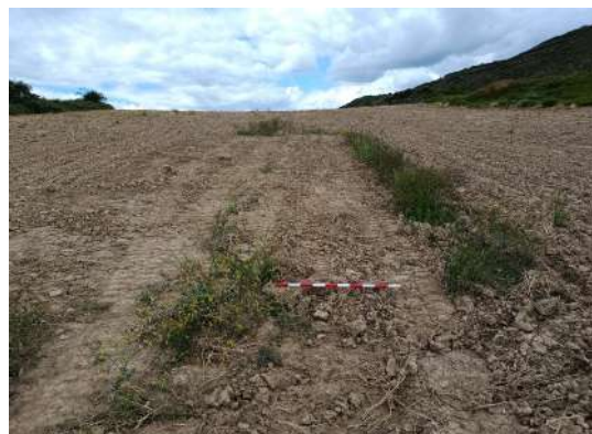
Secuencia de trabajos efectuados en el sondeo 1: replanteo, proceso de trabajo, resultados, ubicación, zona profundizada, cantiles resultantes, cata inundada y tapado de la misma