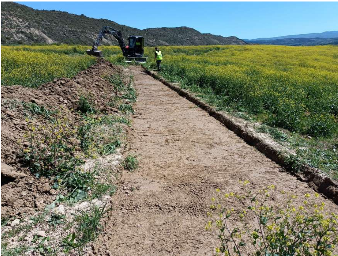
Decapado en la banda de protección de Uñesa I

negativa de naturaleza arqueológica en el proceso, tampoco restos materiales, por lo que el resultado del desbroce de este área fue negativo.