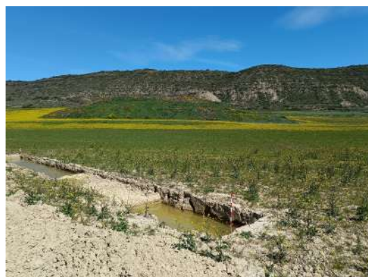
Vistas del sondeo n.º 3 inundado

Es por ello muy complicado poder establecer de forma fehaciente si se preserva algún tipo de estratigrafía relacionada con el yacimiento de Val de Uñesa.