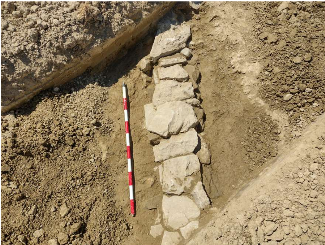
Sondeo n.º 14, general y detalle del drenaje