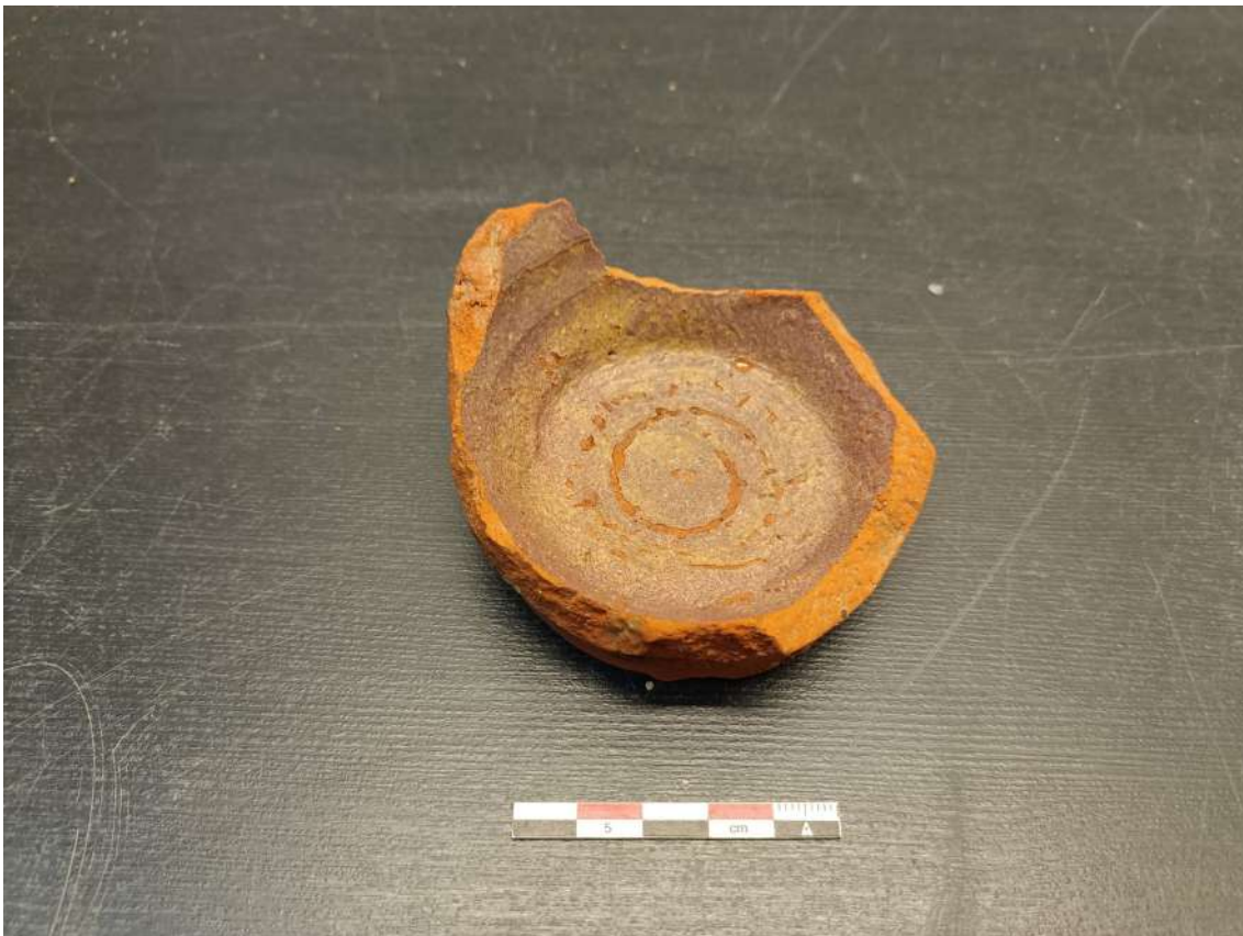
Detalles de las catas 16 y 17 (p. anterior), y cerámica hallada en la n.º 18 (in situ y detalle)