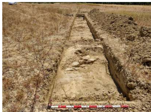
Estructura en cata de sondeo n.º 16

Interesante de estas últimas catas, junto con la 17 y 18, es el fenómeno ya explicado de la profundidad alcanzada por la capa de arcillas beiges , con posibilidad de preservar a cotas cercanas a los -2 metros algún tipo de estratigrafía, de la cual se nos escapa su naturaleza.