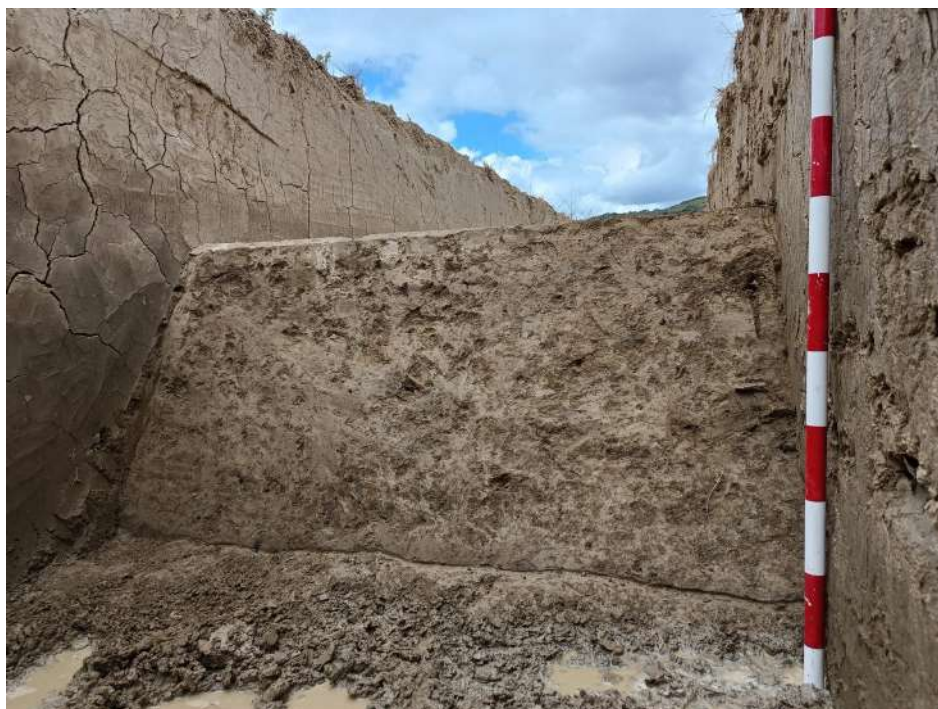
Sondeo n.º 16, cantiles