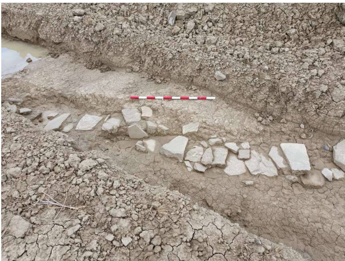
Sondeo n.º 13, generales y detalle del drenaje