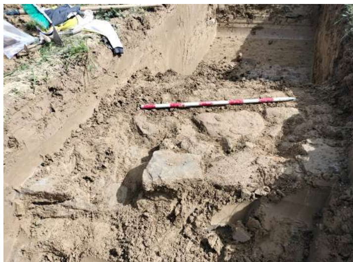
Replanteo del sondeo n.º 4, y descubrimiento de la estructura