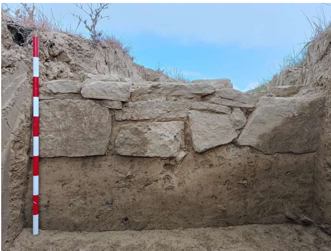
Estructura una vez limpia y excavada

Se pudo documentar perfectamente como conserva un alzado de 40 cm, apareciendo a 20 cm de la superficie; bajo este muro continúan las arcillas beiges homogéneas, por lo que podemos certificar de forma segura que este muro es posterior a la formación geológica por erosión de esta capa de tierras.