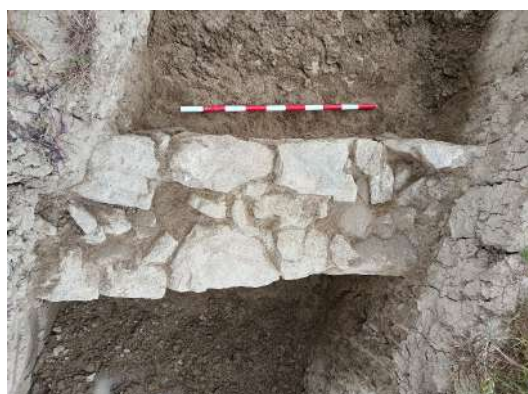
Secuencia de trabajos en la cata n.º 4: inundada, y excavaciones de la estructura

Los hallazgos en estas primeras catas de estructuras y de sedimentos que no podíamos descartar su naturaleza arqueológica, nos llevó a aumentar la campaña de sondeos, de forma ambiciosa, hasta llegar a los 22 citados.