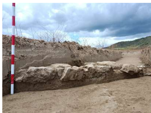
Hallazgo de la estructura en proceso de trabajo, y limpieza de la misma