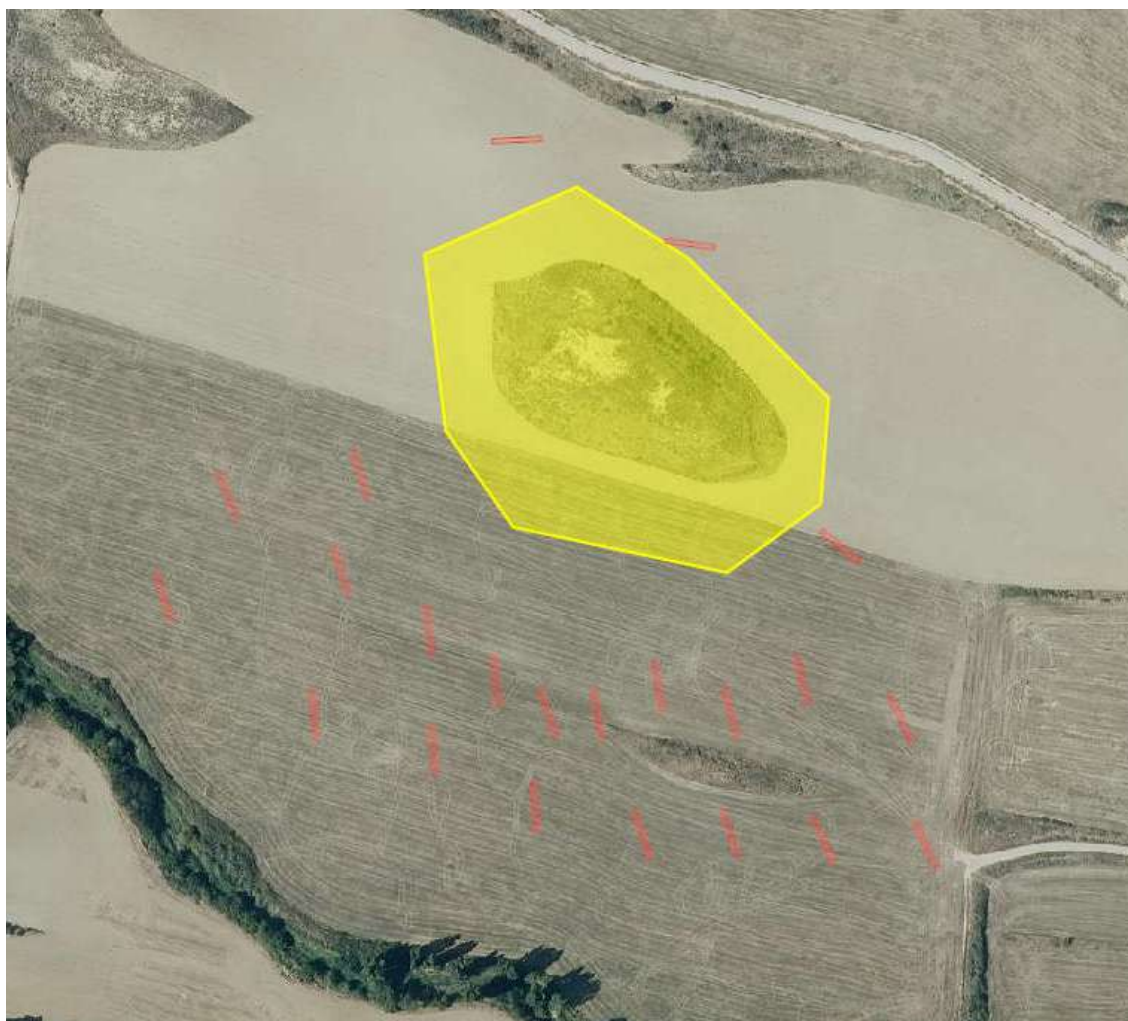
En amarillo, perímetro de Val de Uñesa, en rojo, situación de las catas

Los resultados fueron desiguales en cuanto a la profundidad a la que hubo que descender para alcanzar el suelo geológico (varió entre los 30 cm y los dos metros), y en cuanto al descarte de preservación de restos, o el hallazgo de estructuras y estratos que podrían ser de naturaleza arqueológica. En este caso se tuvieron que realizar varias comprobaciones, limpiezas a mano y pequeñas excavaciones, para verificar o descartar esta naturaleza por un lado, y en los casos positivos tratar de esclarecer la relación de los restos con el yacimiento de Val de Uñesa, ya que la finalidad última de estas catas era la de establecer, en su caso, un nuevo perímetro del mismo.