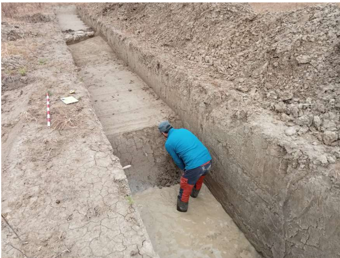
Sondeo n.º 16, proceso de trabajo

Para terminar con la descripción de las catas de sondeo, quedaría por referir las n.º 13 y 14. En ellas se descubrieron sendas alineaciones de sillarejos de arenisca, bloques escuadrados toscamente, como ya pasara en la n.º 3. Si bien aquel sondeo se inundó y nunca pudimos intervenir, los n.º 13 y 14 se pudieron delimitar en superficie y realizar una pequeña excavación, con la que pudimos constatar que se trataban de drenajes.