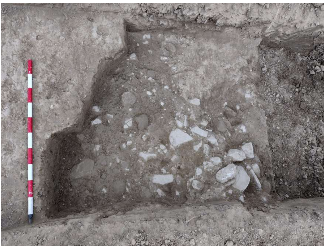
Vista general del sondeo n.º 7, de la ubicación del encachado, y detalle