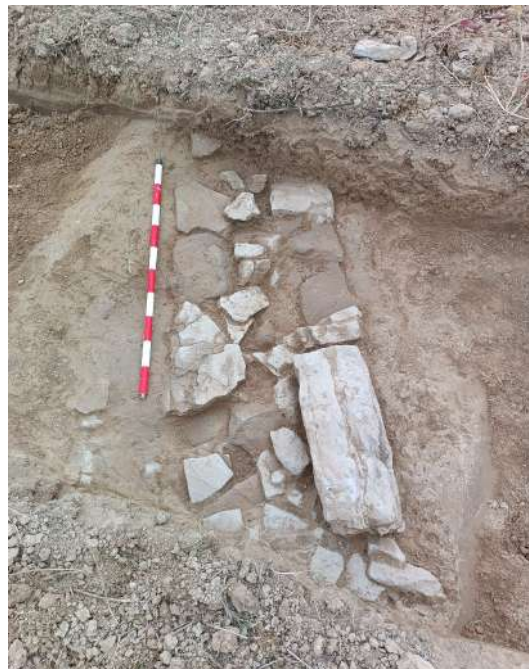
Descubrimiento y limpiezas del muro

En la cata n.º 4 la estructura aparecía en su extremo SE y en la n.º 7 en el NW, lo que nos aseguraba haber podido ver el entorno en torno a este muro en unos 15 metros a cada uno de sus lados. En la cata 4 no había elemento alguno que se pudiera relacionar con la estructura. En la cata n.º 7, sin embargo, existen restos de un enchachado de cantos de río que podrían estar relacionados, a modo de un pavimento, preparación de éste, o simplemente de una zona de paso más o menos acondicionada; no hay otras estructuras más al este, no hay un cierre por el otro lado del pavimento, lo que nos hace descartar posibles edificios. Se trata de una estructura lineal y de muy largo recorrido.