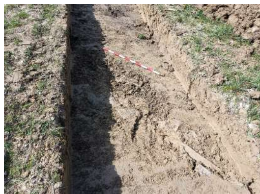
Sondeo n.º 2, detalles de los bloques de piedra alineados

La cata n.º 3 es una de las que se inundó por lluvia nada más realizar la excavación mecánica, dificultando enormemente sus tareas de limpieza (vid. fotos p. 8). En ella se descubrieron una serie de alineaciones de piedras menudas y sin talla, que en un primer momento se identificaron como un posible muro, finalmente se interpretó como un drenaje. Si bien no se ha podido delimitar correctamente esta estructura (nunca se ha secado este sondeo), sí que posteriormente aparecieron estructuras similares, como veremos luego, en las catas muy cercanas n.º 13 y 14, identificadas de forma segura como drenajes (el hecho, además, que esta cata no se haya secado en el mes largo que ha durado la intervención, nos demuestra precisamente la necesidad de drenar este punto del campo).