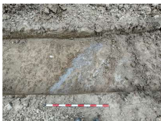
Sondeos 9, 10 y 11, respectivamente, y detalle de vetas geológicas en el n.º 11

En el resto de las catas se alcanzaron bajo la tierra vegetal las arcillas homogéneas beiges , con la particularidad que en algunos casos se veían diferentes intrusiones, como pequeñas motas de carboncillos, algunos fragmentos de cerámica menudos y muy rodados (la práctica totalidad de cronología romana), y algún resto de fauna, muy disperso en este caso.