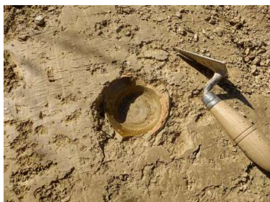
Fragmento de cerámica en cata de sondeo n.º 16

Sabiendo ahora que tenemos estas estructuras, que aparecen a unos 20 cm de profundidad, que conservan alzados de entre 15 y 20 cm, hemos de recordar que se recuperaron dos piezas de cerámica vidriada en las catas cata n.º 16 (45 cm de profundidad), y n.º 18 (80 cm de profundidad).