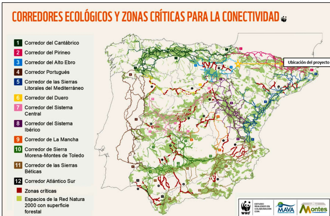
Ilustración 3. Corredores ecológicos respecto al proyecto (2/2) (Fuente: WWF).

Por tanto, el proyecto no afectaría a ningún corredor ecológico ni mucho a menos a alguna de sus zonas críticas para la conectividad.