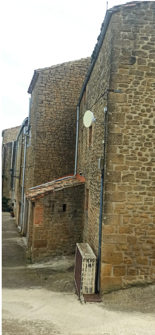
Imagen Ujue Fronton