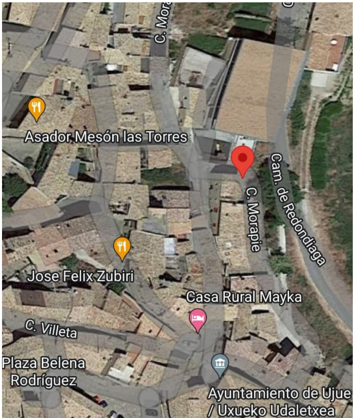
Ujué Fronton Maps