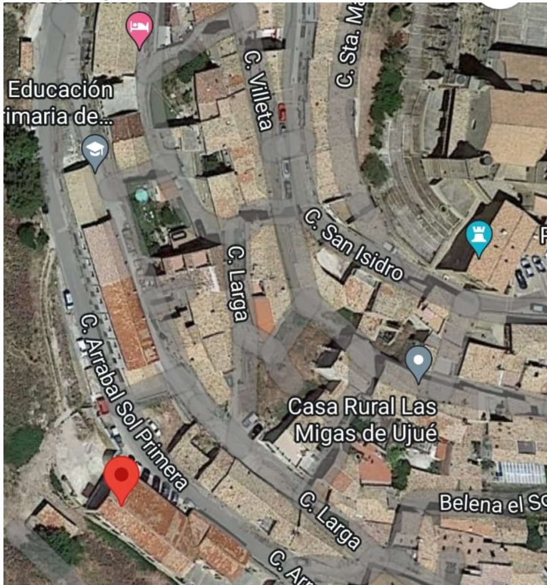
Ujué Jubilados Maps