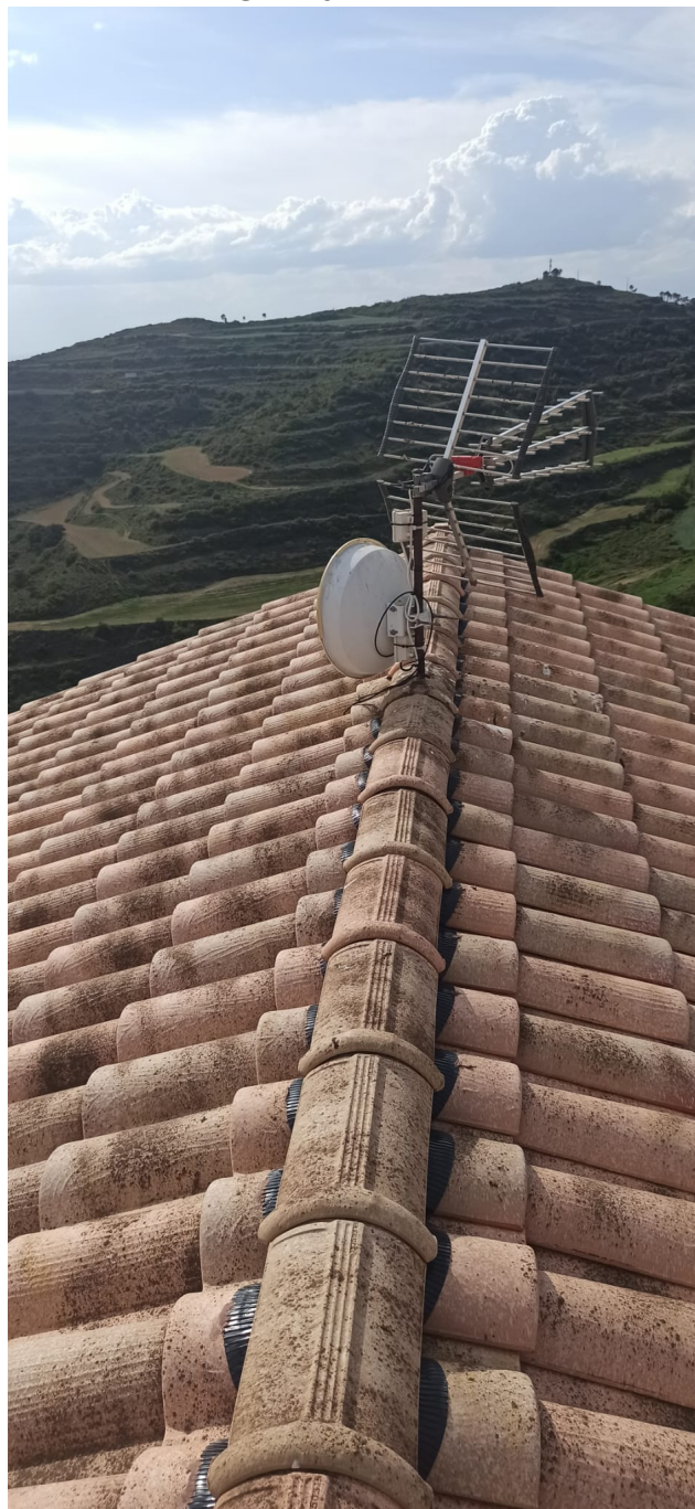
Imagen Ujué Jubilados